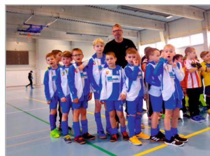
Přípravka před turnajem