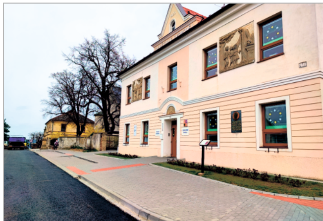
Realizace stavby chodníků a parkovacích zálivů u ZŠ