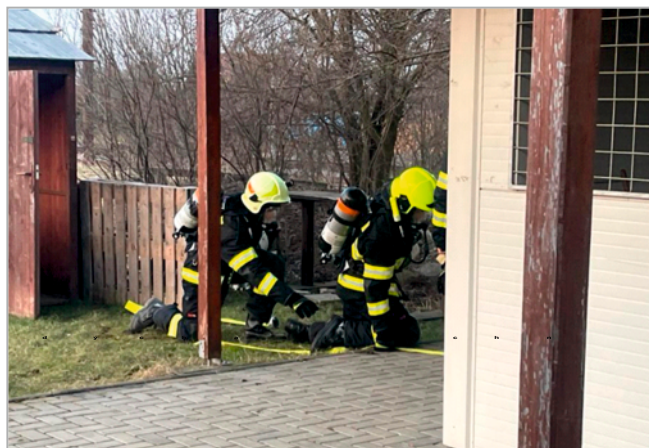
Výcvik nositelů dýchací techniky JSDH Drahanovice

JSDH Drahanovice - během tohoto období jednotka nemusela vyjždět. Aktivita se tak plně zaměřila na obměnu stávajícího dopravního automobilu, na který má obec Drahanovice alokovanou dotaci 450 tis. Kč z MV-Generálního ředitelství HZS ČR a 90 tis. Kč z Olomouckého kraje. Po schválení technických podmínek bude možné vypsat výběrové řízení na dodavatele. Na předání nového vozu se ale budeme moci těšit až spíše ke konci roku 2023. Dále v prostorách hasičské zbrojnice v Drahanovicích došlo v březnu k instalaci odsávacího systému zplodin. Nyní už nehrozí, že by při výjezdu k události museli hasiči z Drahanovic dýchat oblaka zplodin a ničit si tak své zdraví, které nasazují zcela dobrovolně. Instalaci zařízení ve výši 189 tis. Kč hradila obec ze svých prostředků. Systém je zcela nezávislý a spouští se automaticky. V březnu prováděli určení nositelé výcvik s dýchacími přístroji, přičemž práci s těmito prostředky si vyzkoušeli i nováčci, které kurz nositelů teprve čeká.