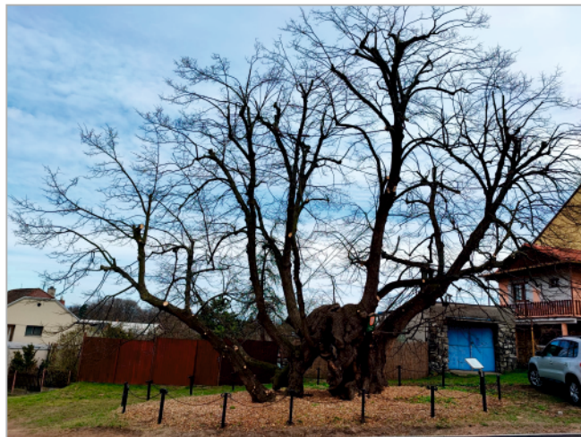
Památná drahanovická lípa nad pomníkem padlých po dokončení odborného ošetření