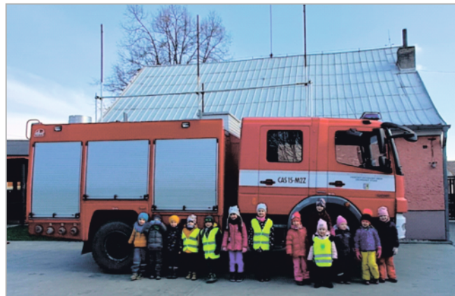
Děti z MŠ Luděrov u "nového" zásahového automobilu JSDH Luděrov - CAS15-M2Z MB Atego.

JSDH Strážov v období od prosince do března řešila 1 událost, která spadá do statistiky roku 2022. Jednalo se o technickou pomoc - záchranu psa, který uvízl v noře, v lese