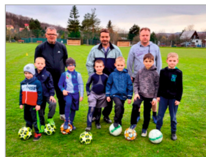
Přípravka na tréninku