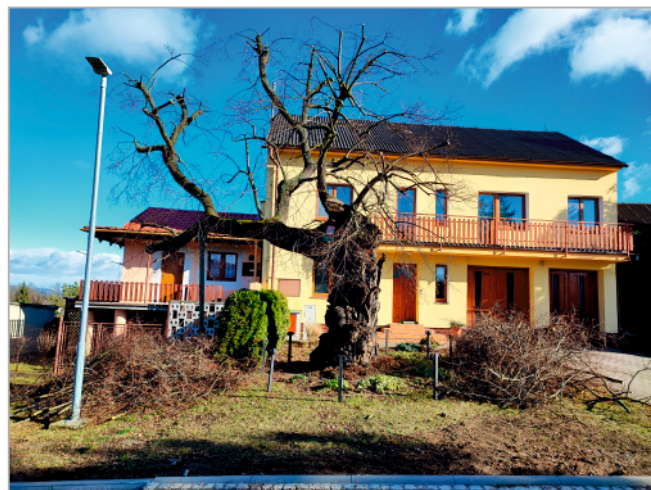
Ošetřená drahanovická památná lípa před č.p. 84

a zdravotní řez senescentního stromu. Náklady na výše uvedená opatření činily celkem 44.286,-Kč vč. DPH.