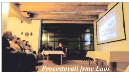
Procestovali jsme Laos