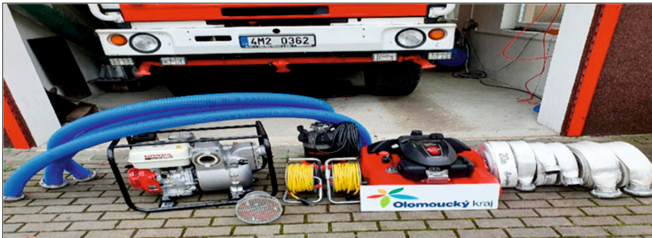
Prostředky na čerpání pořízené JSDH Dahanovice s příspěvím dotace Olomouckého kraje