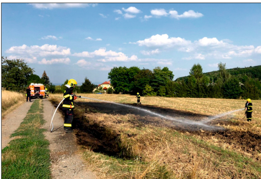
Prověřovací cvičení JSDH Luděřov simulující požár polního porostu