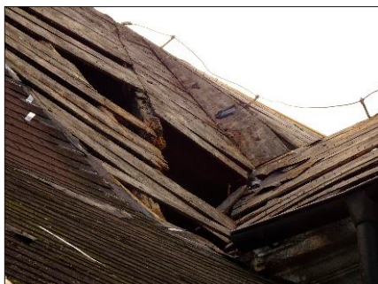
Původní stav krovu