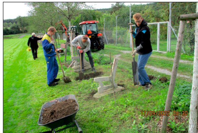
Z brigády na hřišti