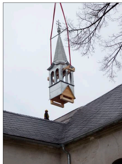
Usazení nového sanktusniku