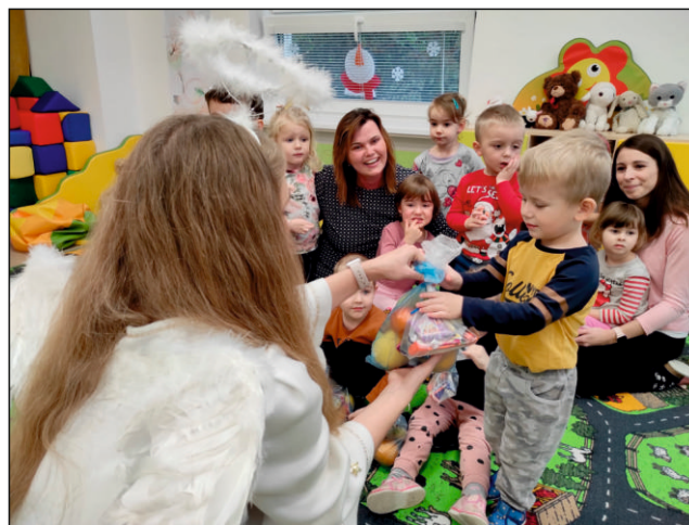
Z Mikulášských nadílek