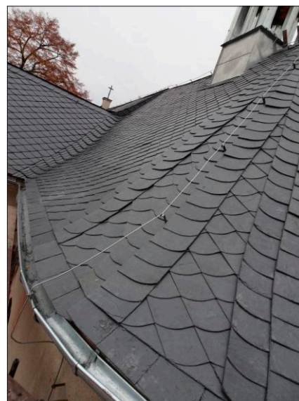
Nově opravená část střechy v r. 2022