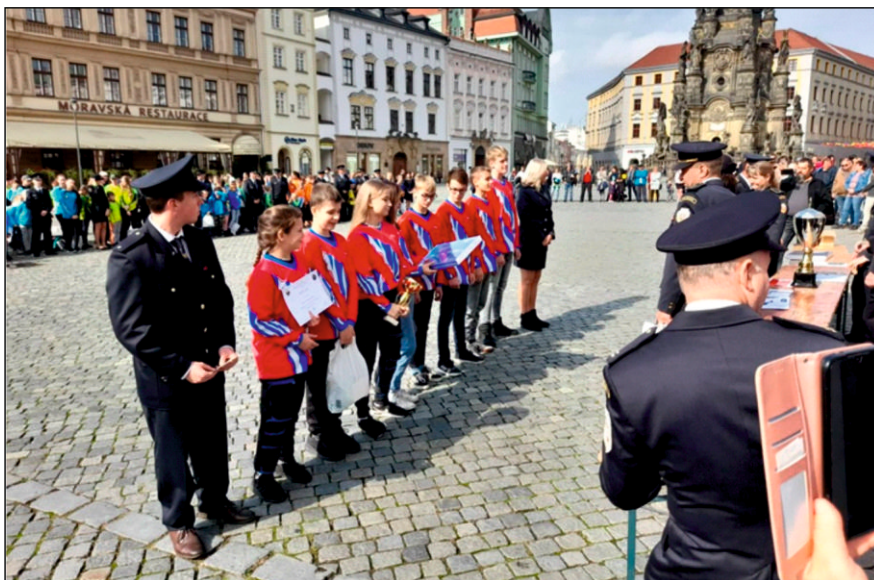
Výhodnocení okresní ligy 2022 Olomouc, Horní nám. – družstvo starších SDH Drahanovice

v současné době není žádný objekt, kde by se mohlo naráz sejít větší množství osob. Pro členy bude připraven svoz, aby se mohli valné hromady účastnit. Na výroční valné hromadě si sbor zhodnotí uplynulý rok a naplánuje si činnost v roce 2023.