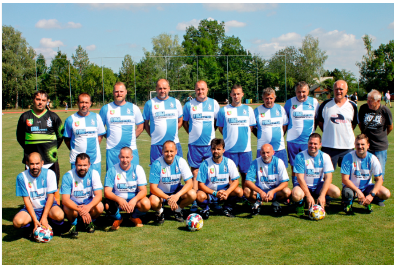
Bývalí hráči Drahanovic před utkáním s mužstvem Čechy pod Kosířem