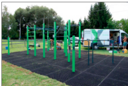
Ilustrační foto: zdroj: město Litovel

Dále bychom chtěli umístit workoutové hřiště postupně do všech místních částí obce (Luděrov, Střížov a Drahanovice). Venkovní workoutová hřiště za posledních pár let prodělala obrovský boom a vývoj směrem kupředu. Jedná se o koncept venkovní posilovny, která je určena pro cviky s vlastní vahou. Nejsou zde žádné pohyblivé části. Základ tvoří žebřiny, bradla, lana, úchopy, úchyty a lavice. Je tedy kladen důraz na základní dovednosti - kliky, shyby, dřepy, lezení, apod.