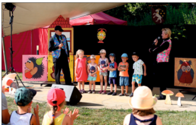
Z programu pro děti v rámci oslav 700. výročí založení obce