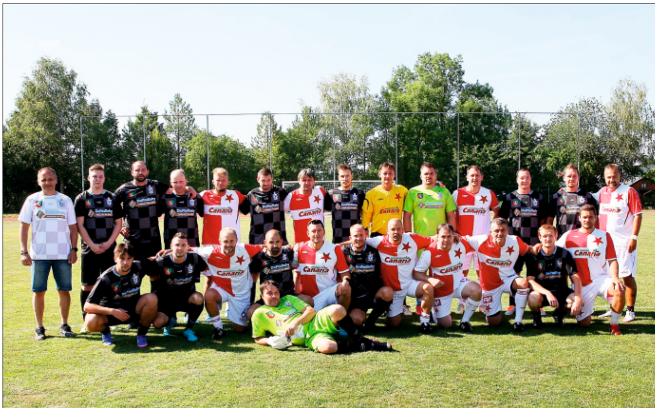
Společná fotografie Drahanovice - SK Slavia Praha