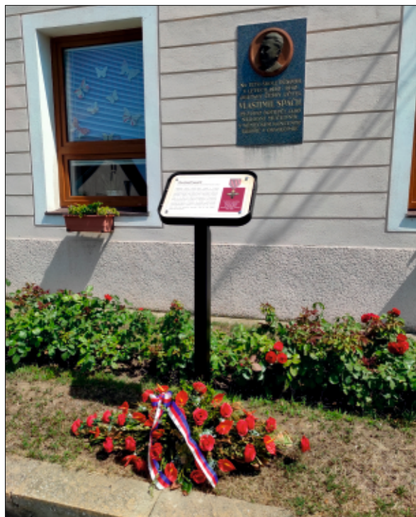
Nová pamětní deska před školou