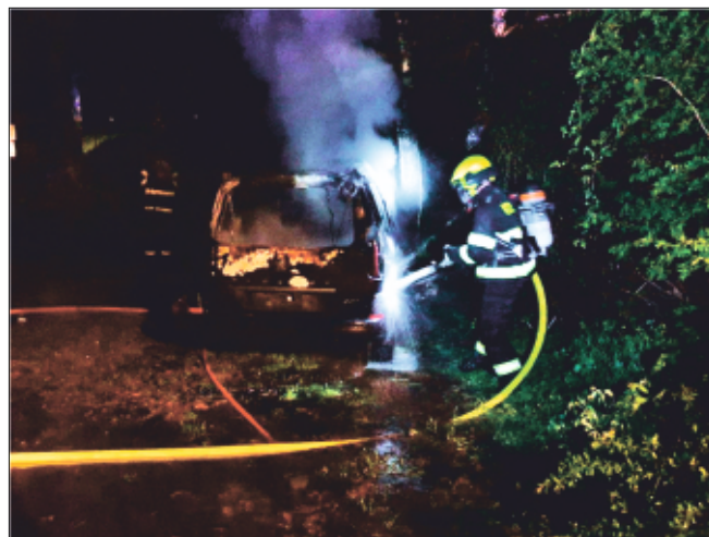
Likvidace požáru osobního vozidla, dne 5. května 2022 v Drahanovicích

Drahanovice celkem 9 událostí. Z toho byly 3 události ostré zásahy a jednalo se vždy o požár. Konkrétně požár kontejnerů na sběrném místě v Drahanovicích, dále požár osobního vozidla také v Drahanovicích a nakonec požár lesního porostu mimo katastr obce Drahanovice. Dalších 6 událostí již bylo spojeno s činností pro zřizovatele, konkrétně 3x dováželi členové JSDH vodu na rozhlednu Velký Kosíř, dále zalévali obecní zeleň, plnili vodou zátěže k pódiu na oslavách 700 let založení obce a zde také prováděli i požární dozor.