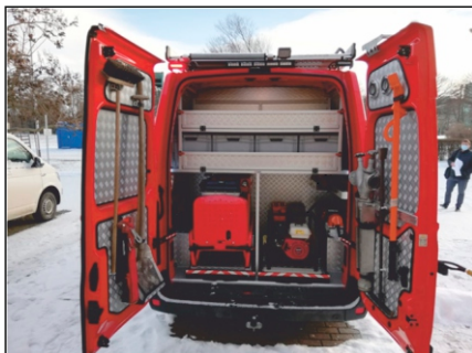
Nový dopravní automobil JSDH Střížov