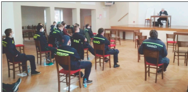
Školení řidičů-referentů 20.2.2021 v KD Luděrov