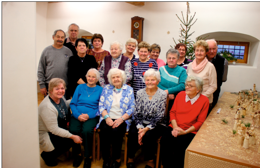
Ze setkání seniorů na sýpce v Luděřově