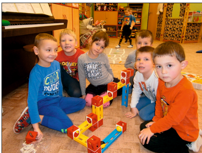
Nadílka v Mateřské škole