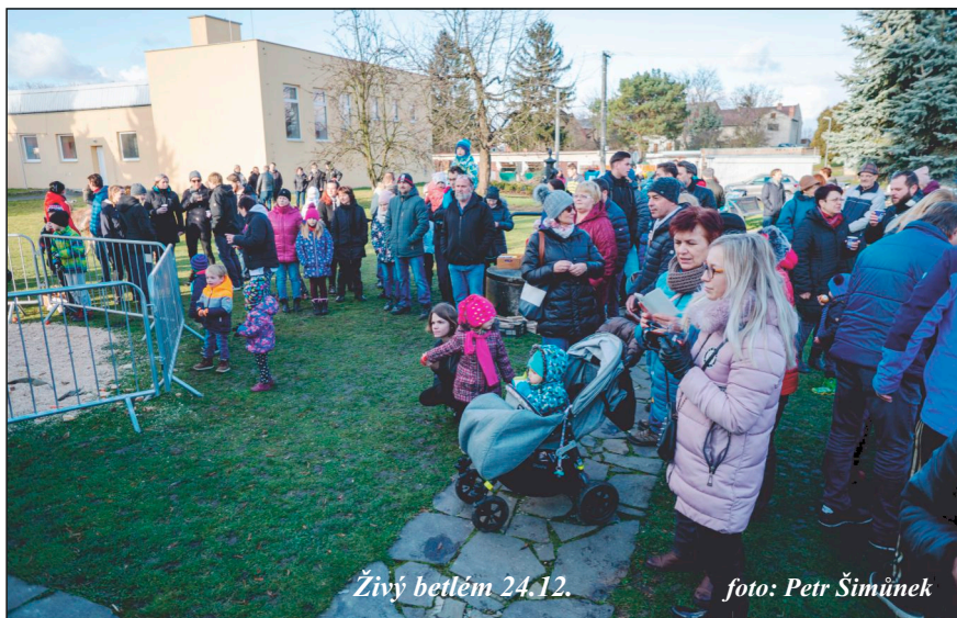
Živý betlém 24.12.