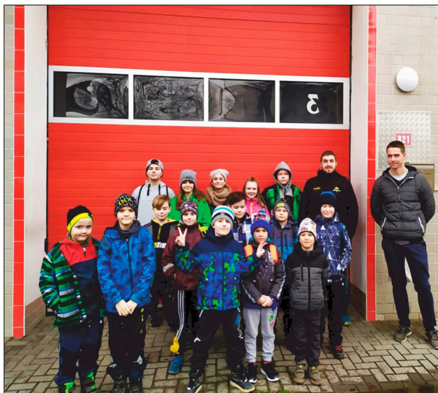
Foto z návštěvy stanice HZS v Litvli.

Sbor dobrovolných hasičů ve Střížově zahájil rok 2020 v pátek 10. ledna