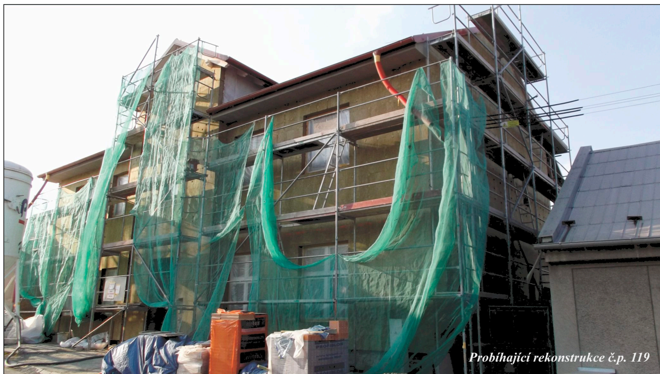
Probíhající rekonstrukce č.p. 119

opět schválen program na podporu spolků a občanských sdružení v obci. Pro rok 2020 byla alokována částka 500.000,- Kč. Celkem se letos sešlo 7 žádostí v celkové částce 457.200,- Kč. Dne 09.03.2020 zasedla výběrová komise, složená z rady obce, předsedů finančního a kontrolního výboru a zastupitele obce. Komise prověřila, ohodnotila, diskutovala a potom kladně rozhodla vyhovět žádostem o dotaci pro: SDH Střížov v částce 70.000,- Kč, SDH Lhota pod Kosířem v částce 15.000,- Kč, TJ Sokol Drahanovice z.s. v částce 180.000,- Kč, SDH Drahanovice v částce 40.000,- Kč, sdružení U Nás, z.s. v částce 25.000,- Kč, Myslivecký spolek Drahanovice z.s. v částce 25.000,- Kč a SDH Luděřov v částce 82.200,- Kč a doporučila zastupitelstvu obce Drahanovice vyhovět všem podaným žádostem o dotaci. Vzhledem k současnému nouzovému stavu v ČR nevíme, kdy se zastupitelstvo obce Drahanovice sejde, nemáme schválený rozpočet na rok 2020 a tím