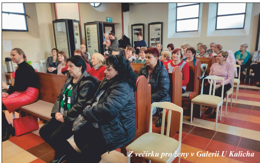
Z večírku pro ženy v Galerii U Kalicha