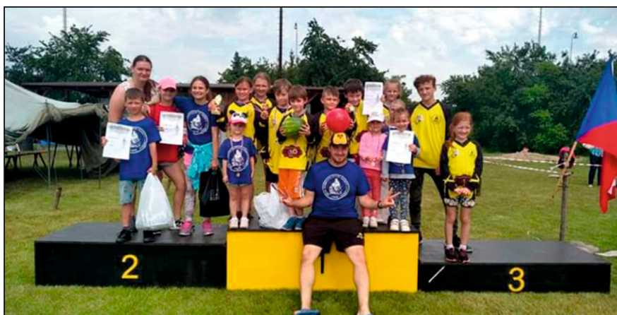
Mladí hasiči na soutěži okresní ligy „Kinder LUDRA Cup“

Od dubnového vydání obecního zpravodaje máme v našem okrsku č. 5