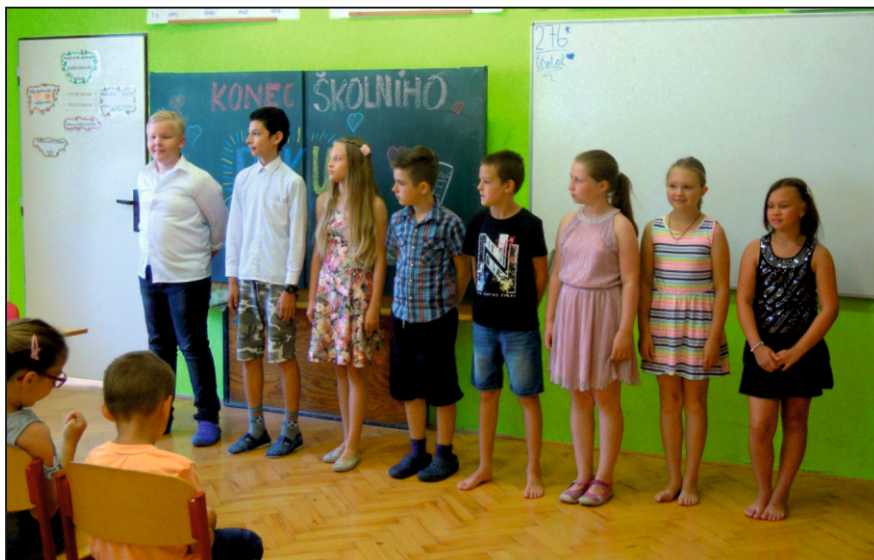
Rozloučení s „pátáky“

Na konci června jsme se rozloučili s osmi páťáky, kteří přechází na 2. stu-