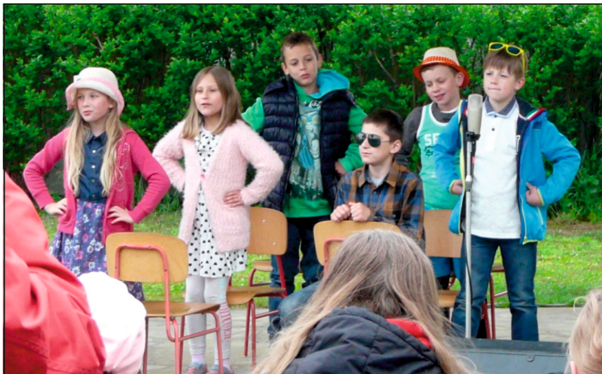
Vystoupení žáků na Dni matek u Černé věže

Samy děti se zapojují, jako již každý rok, do nácviku dvou veřejných vystoupení. V prosinci to byla vánoční besídka, tentokrát na téma „Češi ve světě“ a v květnu na Den matek vystupovaly u Černé věže ve smyslu „Láska kvete v každém věku“. Naše vystoupení se setkávají s nadšením jak u dětí tak i diváků. A školní kolo recitační soutěže, kterou pořádáme vždy na jaře je takovým malým tréninkem vystupová-