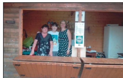
Foto z hodů