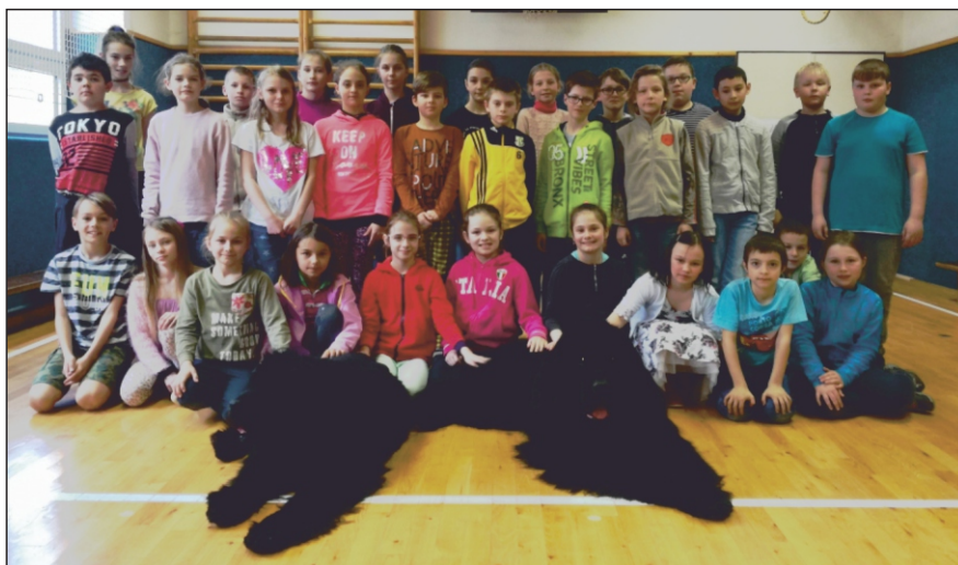
Z besedy, jak se chovat k pejskům

Na jaře všichni žáci navštívili zámek v Náměšti na Hané s programem