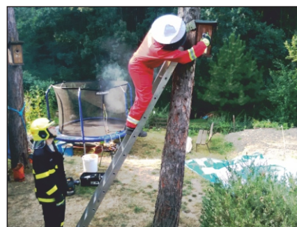
Likvidace obtížného hmyzu - chatová oblast Střížov