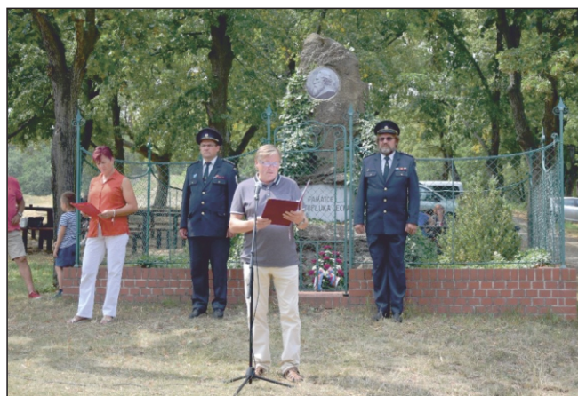
Slavnostní zahájení oslav 110. výročí postavení pomníku Svatopluka Čecha na Příhoně v Luděřově

let. Zčásti byla tato výstava věnována i obnově zeleně na Příhoně, která proběhla v rámci projektu „Revitalizace zeleně v extravilánu obce Drahanovice“ letos na jaře.