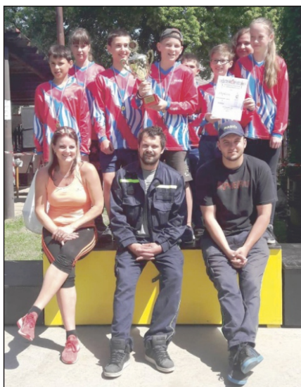
Vítězné družstvo starších žáků z Drahanovic