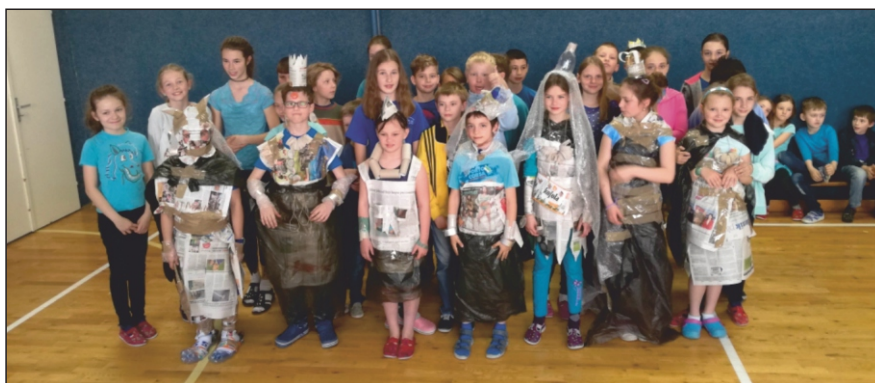
Modní přehlídka z recyklovatelných materiálů

V každé třídě jsou umístěny koše na tříděný odpad (papír, plasty, ostatní směsný odpad a nápojové kartony), všichni žáci jsou poučeni o nutnosti třídít odpad, o využití druhotných