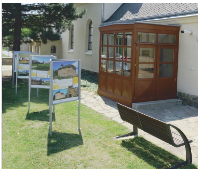
Výstava „Má vlast cestami proměn“ v Galerii U Kalicha