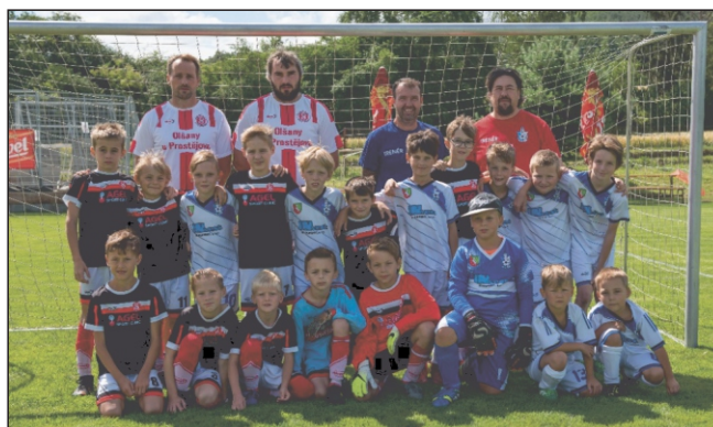
Přípravky Drahanovice - Olšany