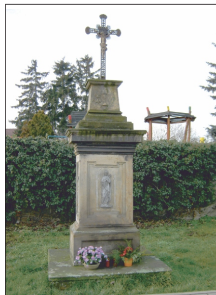
Křížek Na Nové před rekonstrukcí

Sbor pro občanské záležitosti obce Drahanovice srdečně zve občany na