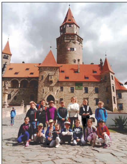
Z výletu na Bouzov

rekreačního zařízení Krajina Duše na Lhotě pod Kosířem, kde strávili nádherný víkend během kterého si procvičili různé dovednosti hasičiny a také pořádali výlety. Při pochodu na Velký Kosíř plnili různé úkoly a na vrcholu je čekal závod na rozhlednu na čas. Z rozhledny pokračovali pěšky do Drahanovic podpořit naše mladé členky, které v rámci oslav založení TJ Sokol Drahanovice vystupovaly na místním fotbalovém hřišti jako mažoretky. Nedělní výlet na hrad Bouzov byl také velmi zajímavý, na zpáteční cestě stihli mladí hasiči ještě navštívit Trojského koně a zahrát si člověče nezlob se v obřích rozměrech, kdy figurky představovali sami luděrovští mladí hasiči.