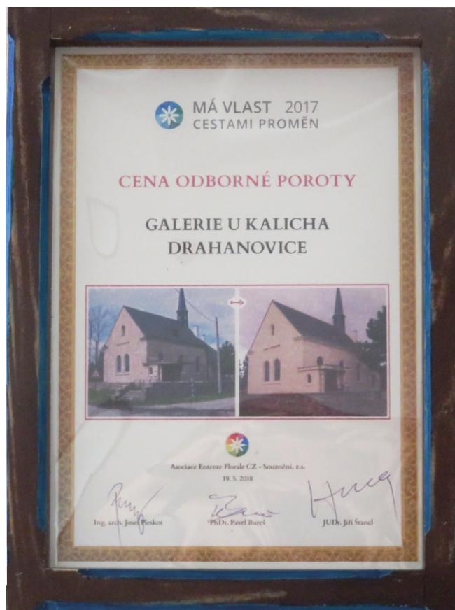
Významné ocenění proměny Galerie U Kalicha