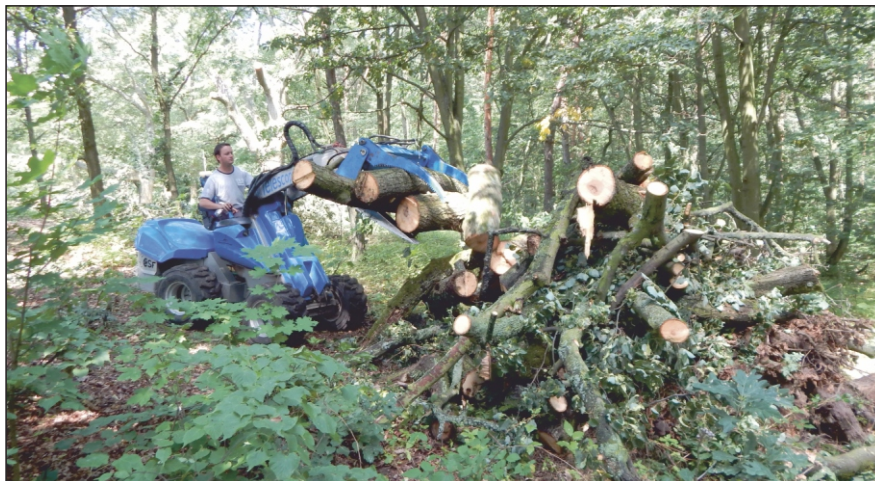
Stavba broukoviště na Příhoně

výstavbu broukoviště, které je podmínkou dotace. Je řádně označeno a to tak, aby nedocházelo k použití větvi na opékání buřtů v blízkém ohništi. Poslední lokalita č. 7 řeší dokončení