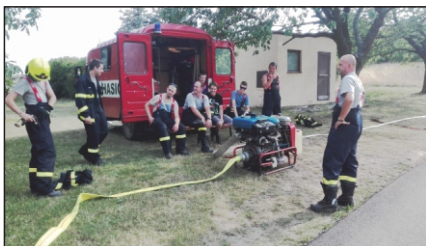
Příprava dálkového vedení nad Střížovem

Zásahové jednotky SDH Drahanovice a SDH Střížov měly po jedné činnosti, spočívající v měsíci červnu v zalévání obecní zeleně. Naše zásahové jednotky v letošním roce vyjžděly již celkem 15x. Z toho zásahová jednotka z Luděrova 12x, zásahová jednotka z Drahanovic 2x a zásahová jednotka ze Střížova 1x. K tomu je ještě třeba připočíst společné taktické cvičení všech 3 našich zásahových jednotek, které se konalo dne 21.7.2018 v 17,00 hodin v rámci oslavy 110 let postavení pomníku Svatopluka Čecha na Příhoně nad Luděrovem. Spočívalo v dálkovém vedení vody ze střížovského rybníka na Příhon v délce 750 m. Kromě zpestření programu oslavy taktické cvičení našich zásahových jednotek prověřilo síly, zdroje, komunikaci mezi zásahovými jednotkami a dovednosti při přípravě na dálkové vedení vody např. při možném požáru lesa nebo odčerpávání vody po bleskových povodních.