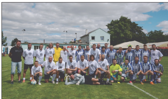
Drahanovice - Sigi team