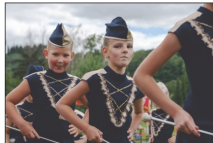
Vystoupení mažoretek z Drahanovic