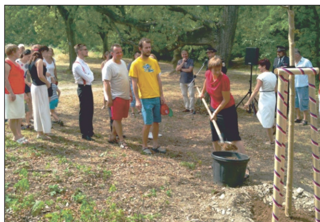
Sázení lípy u pomníku Svatopluka Čecha na Příhoně