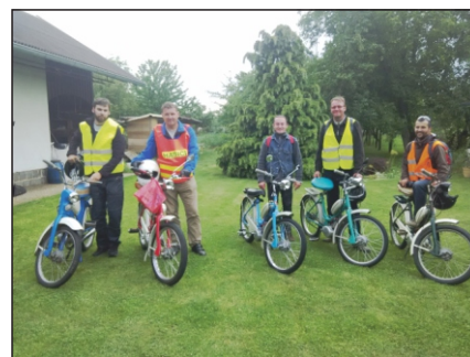
Účastníci pouti na Svatý Hostýn