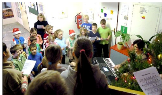
Zpívání na schodech u stromečku

Na poslední den ve škole před Vánocemi bude vzpomínat jen 22 dětí ze 60, protože většinu skolila viróza, nachlazení, chřipka a obávaná rýmečka. I přesto jsme si zazpívali všichni koledy na schodech u stromečku.