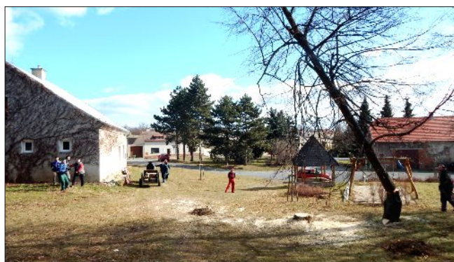
Kácení obecní zeleně v okolí dětského hřiště ve Dvoře

Další Výroční valná hromada v našem okrsku se konala dne 7. ledna 2017 v hasičské klubovně ve Vale v Luděrově. SDH Luděrov zrekapituloval svou bohatou činnost za rok 2016. Letošní tradiční hasičský ples se v Luděrově nekonal z důvodu prováděné komplexní rekonstrukce místního Kulturního domu. Brigády byly zaměřeny na likvidaci dřevěného pódia v kulturním domě v Luděrově, kácení obecní zeleně v parčíku u kaple Panny Marie Růžencové, v okolí dětského hřiště ve Dvoře a v areálu ve Vale. V současné době probíhá příprava letní sezóny a na Oslavu patrona hasičů sv. Floriána, která se uskuteční dne 6.5.2017 v Luděrově. Zvláštní pozornost je věnována přípravě oslavy 125.-tého výročí založení SDH Luděrov, která proběhne dne 2. září 2017 v Luděrově. Při slavnostní mši svaté v luděrovské kapli Panny Marie Růžencové bude požehnan nový ručně vyšíváný historický prapor SDH Luděrov, který v současné době již vyrábí firma Alerion s.r.o. v Brně. Zásahová jednotka SDH Luděrov má na svém kontě letos 2 výjezdy – technické pomoci. 2. 2. 2017 to byla technická pomoc při odstranění sněhu ze střechy na