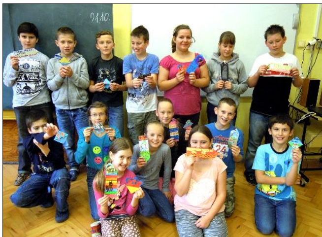
Záložka do knihy spojuje školy

Během října jsme se již potřetí přihlásili do projektu pro podporu čtení a spolupráce „Záložka do knihy spojuje školy“ a děti malovaly, lepily, stříhaly, zdobily svoji záložku pro