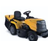
SEKACÍ A MULČOVACÍ TRAKTOR