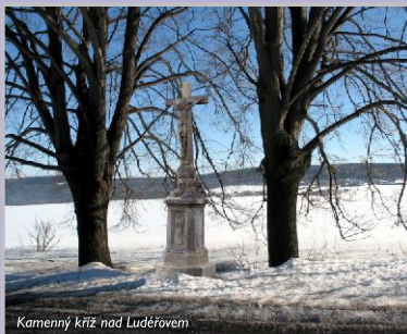
Kamenný kříž nad Luděovem

Příjemné prožití vánočních svátků, v novém roce pevně zdraví a mnoho osobních i pracovních úspěchů přeje starosta obce Drahanovice