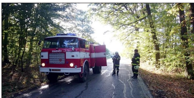
Likvidace spadlého stromu u Lhoty p.K.

pe něho hmyzu celkem 10x. Zásahové jednotky ze Střížova a ze Lhoty pod Kosím v druhé polovině léta a na podzim nezasahovaly. V letošním roce 2016 evidujeme v našem okrsku 5 Drahanovice celkem 22 výjezdů zásahových jednotek. Nejvíce výjezdů – celkem 19 měla zásahová jednotka z Ludéova, 2 výjezdy zásahová jednotka z Drahanovic a 1 výjezd zásahová jednotka ze Střížova.