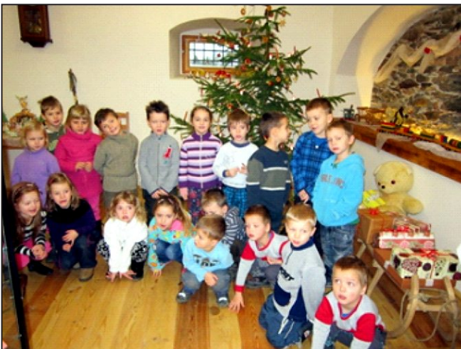
Váno ní návšt va Sýpky – prosinec 2015