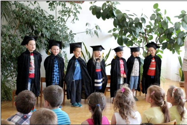
Pasování školák – červen 2016