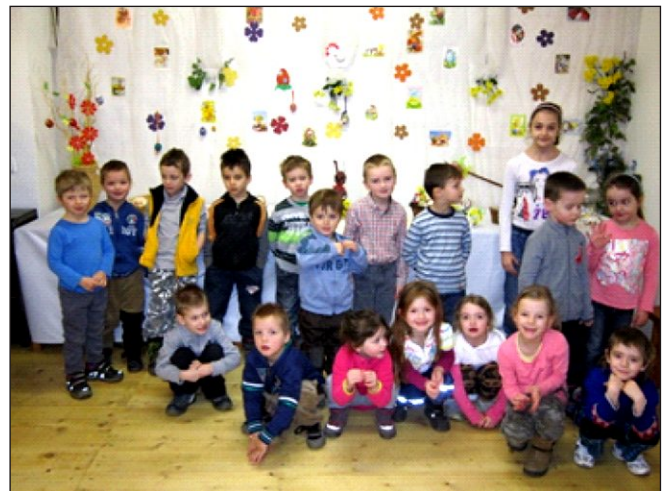
Velikono ní návšt va Sýpky– duben 2016