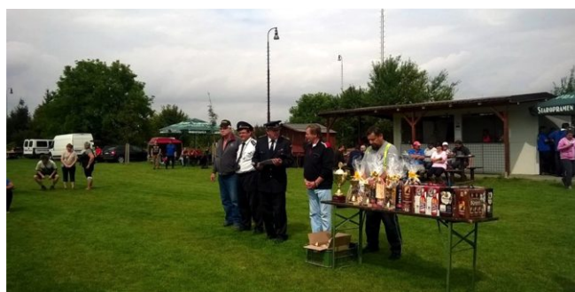
O Putovní pohár starosty obce Drahanovice

Nyní ještě v krátkosti o činnosti v jednotlivých Sborech: SDH Drahanovice uspěl dne 13. 8. 2016 pohárovou soutěží „O putovní pohár starosty obce Drahanovice“, které se zúčastnilo celkem 16 soutěžících družstev, z toho 10 družstev mužů a 6 družstev žen. Putovní pohár starosty obce Drahanovice si v kategorii muži odvezli hasiči z Ludéova, na