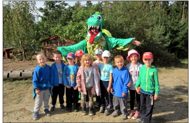
S Drákem na Velký kosí – p edškoláci zá í 2016