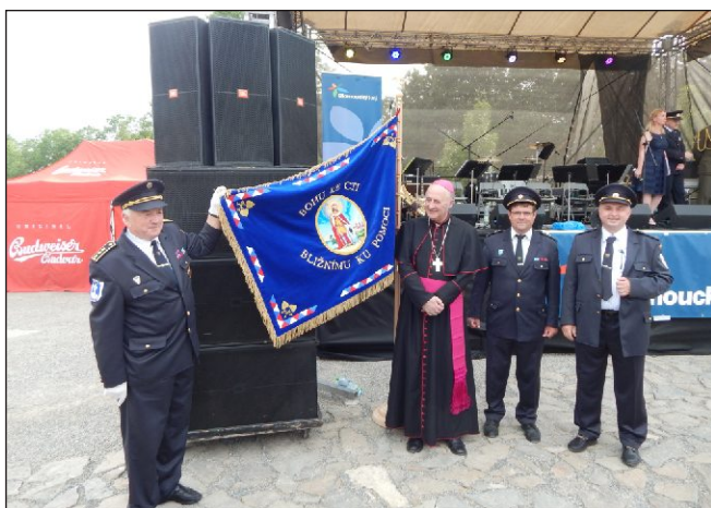
Prapor a křtění knihy "Dobrovolní hasiči Olomouckého kraje".