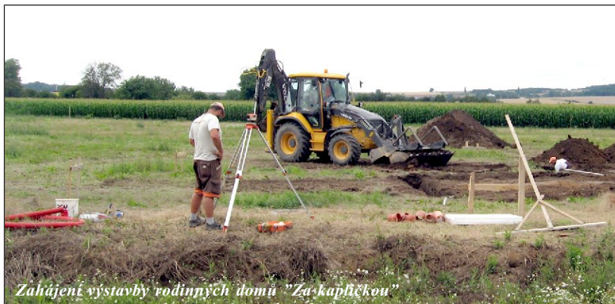
Zahájení výstavby rodinných domů "Za kapličkou"

2017. I my jako obec jsme projektově, tak finančně připraveni a společně s opravou silnice proběhne výstavba chodníků a parkovacích zálivů. Toto se jedná o silnici II/448. Následně byla podána žádost na vedení Olomouckého kraje o generální opravu průtahu obcí silnic III/44812 a III/44813 a v tomto nám byla přislíbena podpora už z toho důvodu, že Olomoucký kraj spravuje zámek v Čechách pod Kosířem a už jenom silnice přes Drahanovice není opravena. Obec má vypsanou soutěž na výběr projekční společnosti, která bude zpracovávat projekt chodníků a zálivů v celé zbylé části obce, který bude hotov do 30. 4. 2017. Tak budeme připraveni kdykoliv práce společně s Olomouckým krajem zahájit. Tím si ale nemůžeme říct „s kanalizací hotovo“. Je zde ještě část obce Lhota, která zatím napojena není. V této chvíli jsou zpracovány dvě varianty – jedna napojení na ČOV Drahanovice a druhá vlastní malá ČOV ve Lhotě. Probíhají jednání na krajském úřadě a zastupitelstvo obce bude do konce roku rozhodovat o té výhodnější. A ještě ke kanalizaci, jak víte probíhá celkem úspěšně prodej pozemků na stavbu rodinných