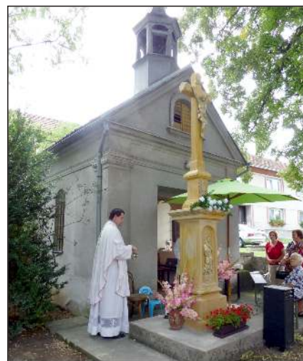
Svěcení křížku ve Střížově

V rámci šetření finančních prostředků se obec zapojila do aukce na dodavatele elektrické energie a plynu a celková vysoutěžená úspora by v příštím roce měla dělat až 200.000,- Kč. Stejným způsobem byla provedena aukce na odvoz odpadů. V prvním kole je vysoutěžena úspora 24,8%, takže v budoucnu bude i odpady odvázet jiná