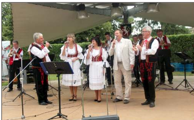
Drahanovické hody – dechová kapela z Velkých Vozokan

Další dlouhodobou snahou Mikroregionu Kosířsko je výstavba rozhledny na Velkém Kosíři a i zde došlo k zásadnímu zlomu a to tak, že stavba byla na červnovém zasedání zastupitelstva Olomouckého kraje podpořena 3 miliony korun a to v rámci "Významných projektů Olomouckého kraje". Vedení