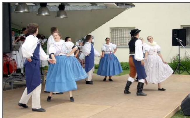
Drahanovické hody – Mladá Haná z Velké Bystřice