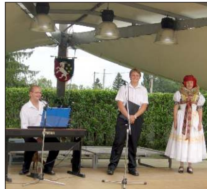
Drahanovické hody – Skřevani nám všem hodně úspěchů v plnění pracovních i společenských úkolů.

Závěrem bych popřál Sokolům úspěšný start do nové sezóny a hlavně její dobrý konec, hasičům příkladně splnění taktického cvičení, myslivcům za jejich celoroční práci ty nejlepší podzimní úlovky, dětem a studentům dobrý start do nového školního roku a