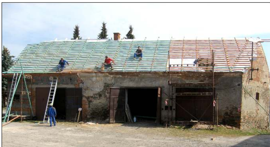
Oprava skladu v Luděřově

Do programu zateplení veřejných budov jsme požádali již potřetí o dotaci na zateplení budovy mateřské školky v Drahanovicích. Zde celkové náklady činí 3,3 milionu korun a procento dotace zatím neznáme. Po vybudování dětských hřišť v loňském roce, bude letos snahou provést revitalizaci okolí těchto hřišť v Drahanovicích a Luděřově na což byly podány dvě žádosti do Programu obnovy venkova. Výsledek zda dotaci obdržíme nebo ne se dozvíme v závěru dubna. V Luděřově probíhá oprava obecního skladu, opravuje se strop, dělá nová střecha, okapy a svody.