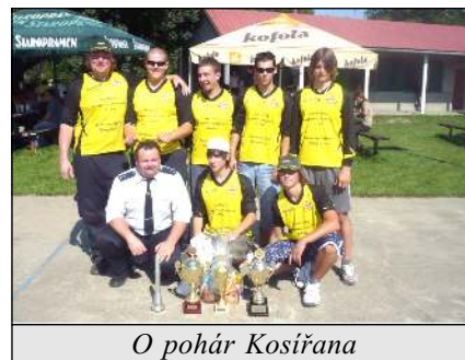
O pohár Kosířana

Starostové našeho okrsku, nebo jejich zástupci se sjeli 27. listopadu na zasedání zástupců všech sborů okresu