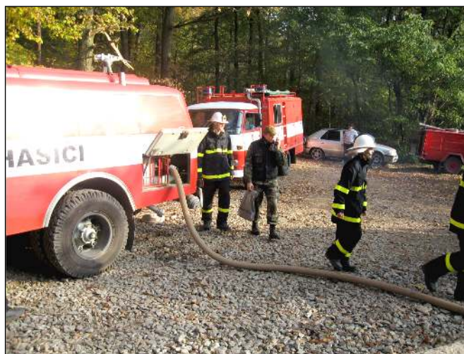
Taktické cvičení - zkouška cisterny