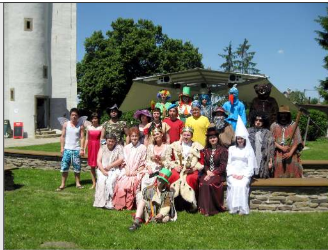
Foto z dalších akcí konaných v letošním roce