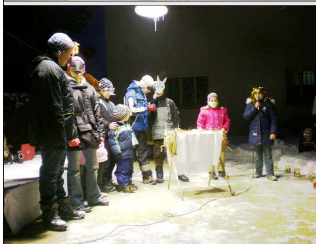
Rozsvícení vánočního stromu s Mikulášem