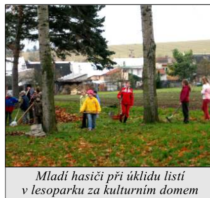
Mladí hasiči při úklidu listí v lesoparku za kulturním domem

ve Skrbeni a zde přijali zásadní úkoly na rok 2011.