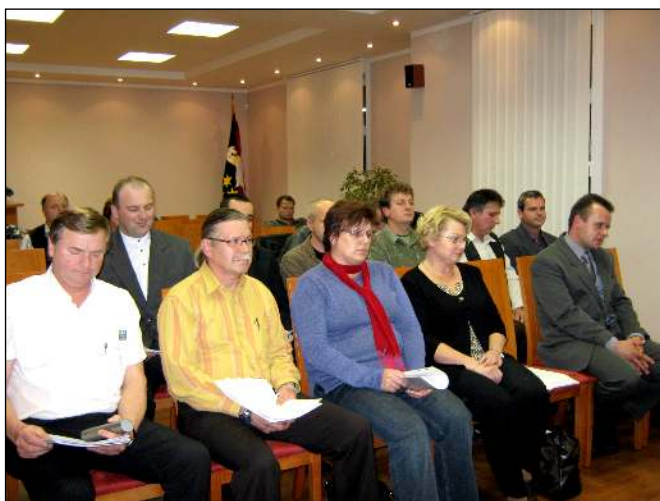
Ustavující zasedání zastupitelstva obce 11.11.2010