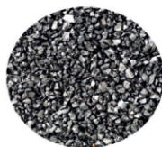
Bílina automaty od 597 Kč/q