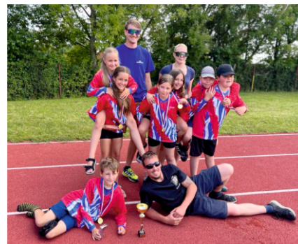
Družstvo mladých hasičů SDH Drahanovice

v Hlubočkách, kde se umístilo na 19. místě, čtvrté kolo v neděli v Kozušanech, kde se družstvo umístilo na 21. místě a zatím poslední kolo proběhlo v neděli 23. června ve Velkém Újezdě, kdy družstvo skončilo na 1. místě. Kromě okresní ligy se družstvo mladých hasičů účastnilo pohárové soutěže v Těšeticích a ve Strážově. V letošním roce se podařilo poskládat i družstvo dorostenců, které také pravidelně