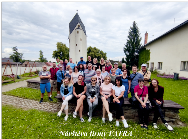
Návštěva firmy FATRA

Pro zajímavost si pravidelně vedu statistiku návštěvníků, abych zjistil, odkud k nám do Černé věže přijíždí nejvíce lidí. Zatím se ukazuje, že největší zájem mají návštěvníci z Brna a Ostravy. Od 21. 4. 2024 k datu 31. 7. 2024 navštívilo Černou věž celkem 542 návštěvníků, což je navzdory mírnému poklesu návštěvnosti památek v ČR poměrně slušné číslo.