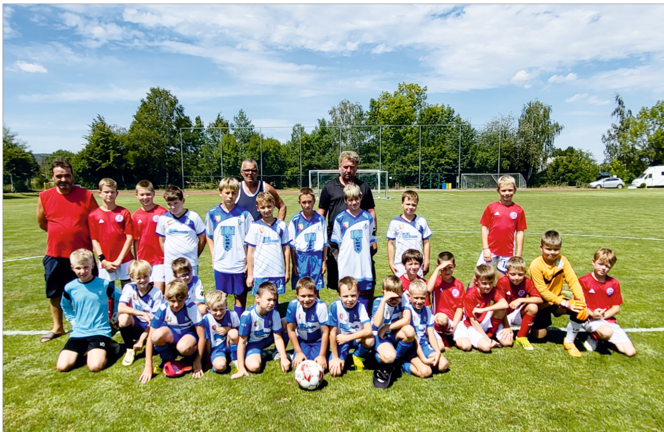
Děti - Drahanovice x Náměšř na Hané