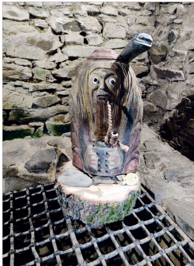
Vodník Emil vznikl přímo pro Drahanovickou výstavu