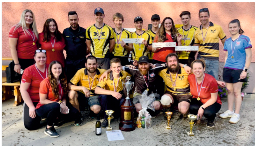
Vítězové soutěže „O putovní pohár sv. Floriána“ - Luděrov 4.5.2024 (Luděrov muži, Vojnice ženy)

V oblasti požárního sportu už téměř plnohodnotně nahradilo muže z Luděrova mládí z dorostenecké „Farmy“. I přesto se muži zúčastnili alespoň zmíněných domácích soutěží. Kluci z Farmy se naopak účastní všech soutěží Olomoucké noční ligy a Hanácké Extraligy. Pravidelné tréninky jsou znát, protože na závodě Hanácké Extraligy v Janovicích obsa-