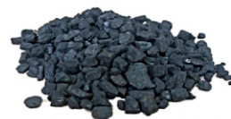
koks, antracit, kovářské uhlí, černé uhlí