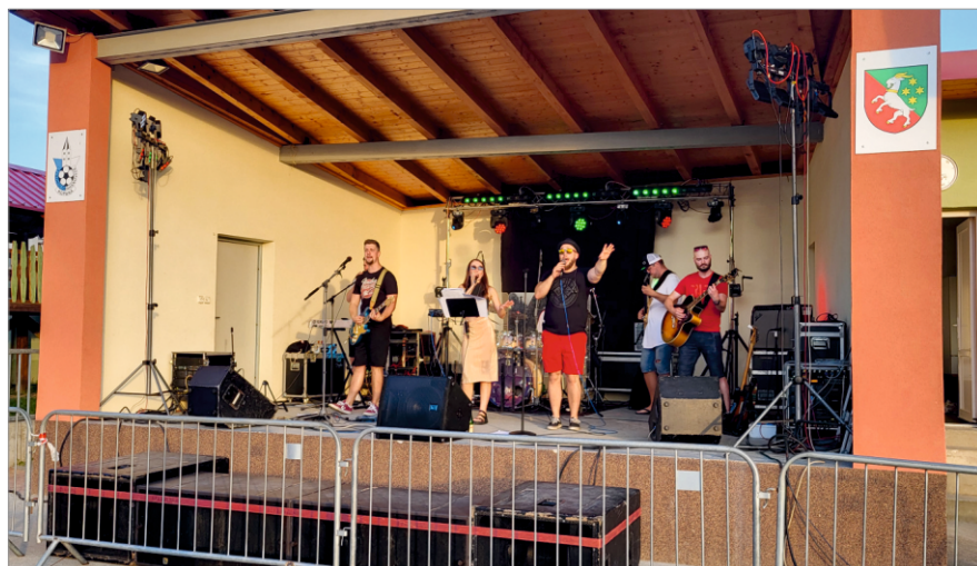
Skupina Noice na hodech 27. července na hřišti