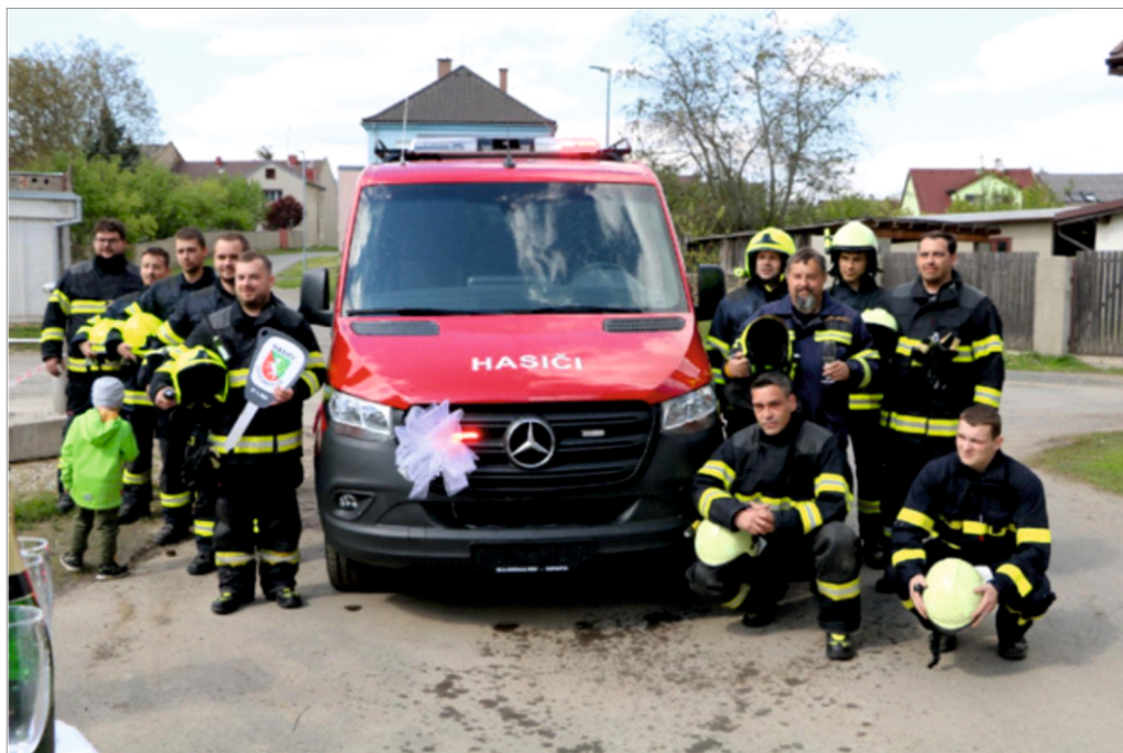
Předání nového dopravního automobilu MB Sprinter pro JSDH Drahanovice.

la hydrantové sítě). Mimo zásahy se členové pravidelně schází i účastní školení, např. v dubnu vybraní členové absolvovali instruktivně-metodické zaměstnání HZS pro jednotky předurčené k činnostem ochrany obyvatelstva. Dále bylo možné techniku JSDH Drahanovice vidět v rámci DNE REGIONU HANÁ v Náměšti na Hané, nebo na soutěži mladých hasičů ve Střížově. Před koncem školního roku uspořádala jednotka z Drahanovic ve spolupráci s SDH Drahanovice branný den pro předškolní a školní děti. Ten se konal na hasičském hřišti "Za kapličkou" v Drahanovicích a děti si tak mohly kromě techniky hasičů z Drahanovic prohlédnout i vozidla Policie ČR. Součástí branného dne byla ukázka první pomoci, ukázka hašení pomocí hasičího přístroje a soutěže pro děti. Akce vzbudila pozitivní ohlasy a v plánu bude zajisté i za rok.