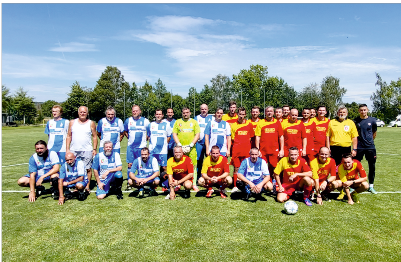
Stará garda mužů - Drahanovice x Čechy pod Kosířem