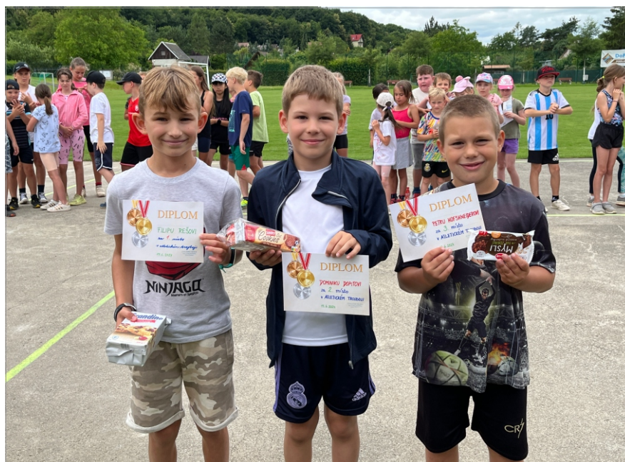
Naši vítězové v atletickém trojboji