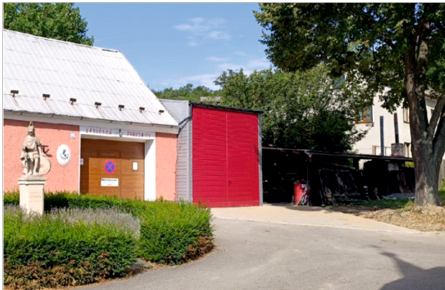
Garáž JSDH Luděřov vedle hasičské zbrojnice v Luděřově