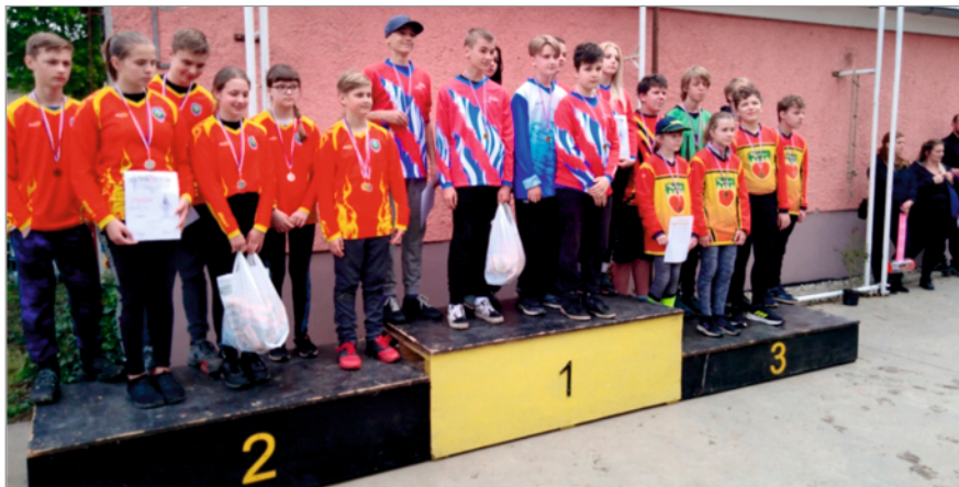
Výhlášení na pohárové soutěži v Luděrově – družstvo starších SDH Drahanovice na 1. místě

V měsíci dubnu uspořádali hasiči ze Střížova sběr kovového odpadu po obci. V oblasti mladých hasičů spolupracují s SDH Luděrov, kdy si vzájemně vypomáhají. Od měsíce dubna začala příprava na letošní sezonu a první