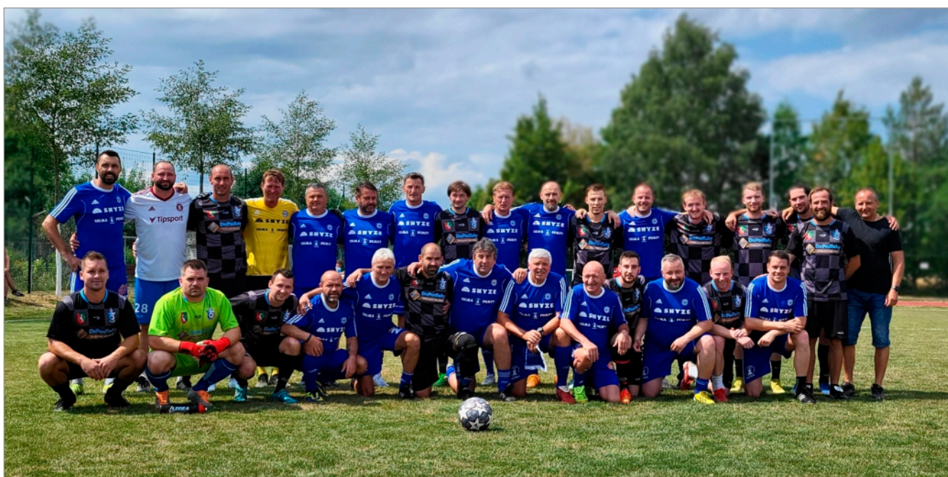
Týmy staré gardy Sigmy Olomouc a Drtiče TJ Sokol Drahanovice

kolegům z výboru i mimo něj za pomoc. Snad nám tam bude na podzim stát již sekačka nová (stávající je již ve velmi špatném technickém stavu), o kterou máme v rámci dotací z Olomouckého kraje požádáno.