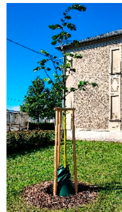
Zálivkové vaky v boji za záchranu stromů v době sucha