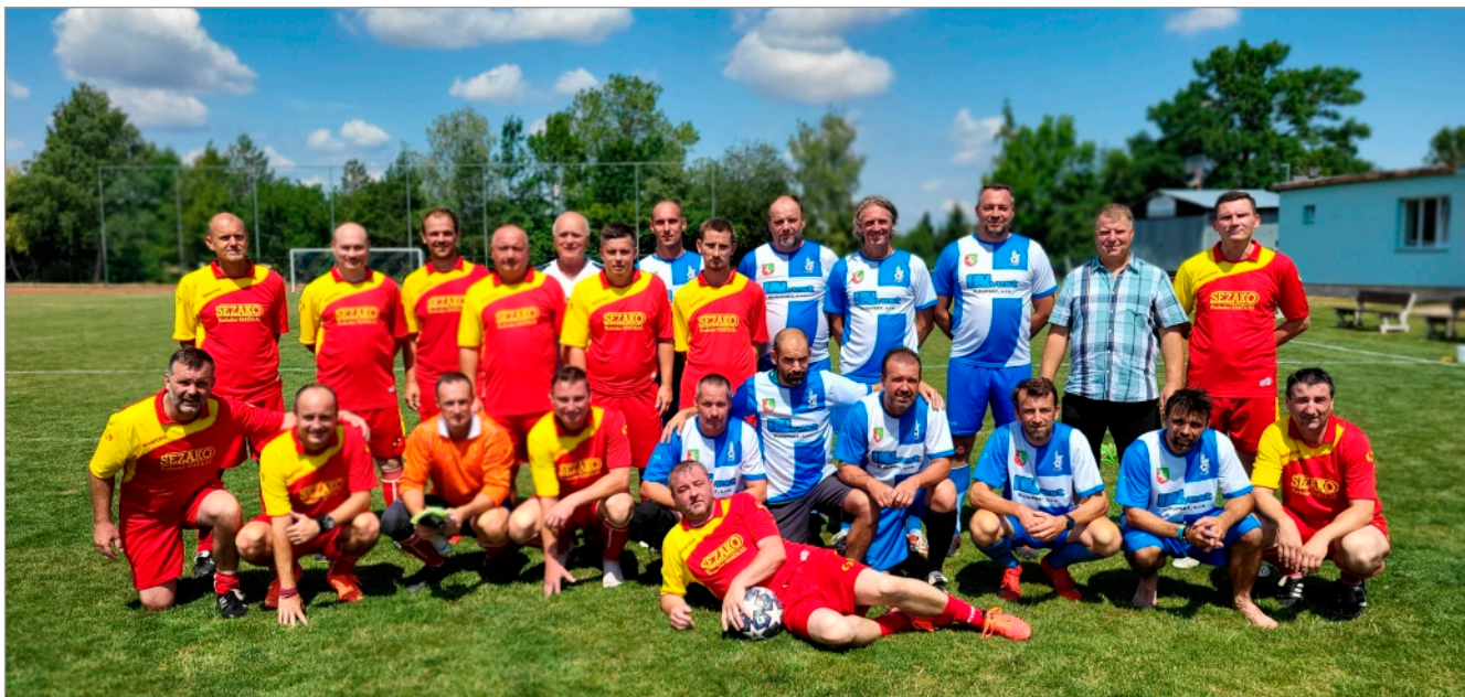
Týmy starých pánů Sokol Drahanovice a Čech pod Kosířem