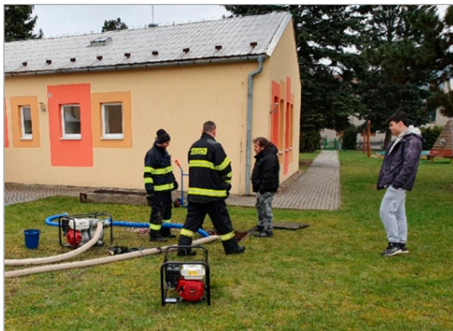
Členové JSDH Drahanovice čerpají vodu z jímky u mateřské školy

JSDH Drahanovice - obec v uplynulém období obdržela informaci o schválení dotace ve výši 450 tis. Kč z MV-Generálního ředitelství HZS ČR na obměnu stávajícího dopravního automobilu. Další 90 tis. Kč pak obec obdrží z Olomouckého kraje. Nyní proběhne výběrové řízení na dodavatele a nový vůz můžeme očekávat zhruba začátkem roku 2024. V dubnu absolvovalo 6 členů kurz pro strojníky a v květnu další 2 členové absolvovali kurz pro velitele. Za období duben-červenec řešila JSDH Drahanovice celkem 8 událostí. Z toho byly 2 události ostré zásahy (transport pacienta pro záchrannou službu a odstranění spadlého stromu na