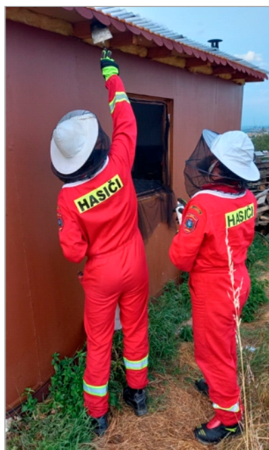
Likvidace vosího hnízda v Luděřově

JSDH Střížov - jednotka v uplynulém období provedla 1x činnost pro zřizovatele, a to výpomoc se stěhováním MŠ Luděřov. Členové jednotky se i nadále schází k odborné přípravě a kontrole techniky. Obec Drahanovice v uplynulých měsících obdržela dotaci z Olomouckého kraje na činnost JSDH Střížov. Částka ve výši 11 tis. Kč bude použita na částečné financování osvětlovací techniky pro potřeby jednotky v rámci operačního řízení.